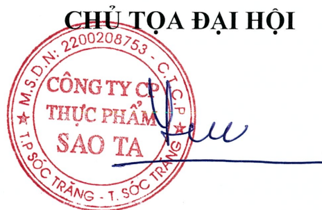
HỒ QUỐC LỰC